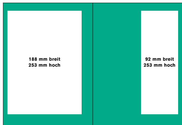
die ganze Seite, Satzspiegel